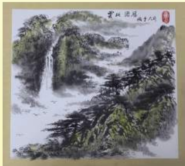
孔宪玉《云山固居》绘画类第三名